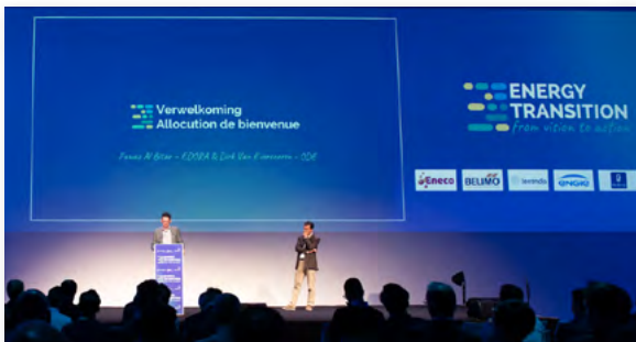
Présentation / slides