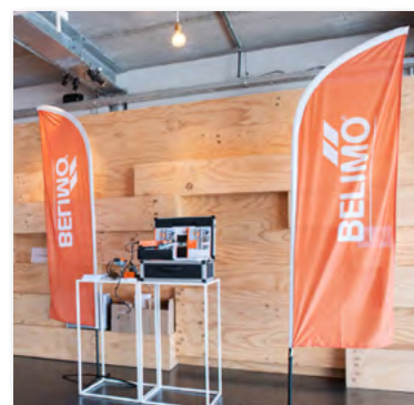
Salle de démonstration