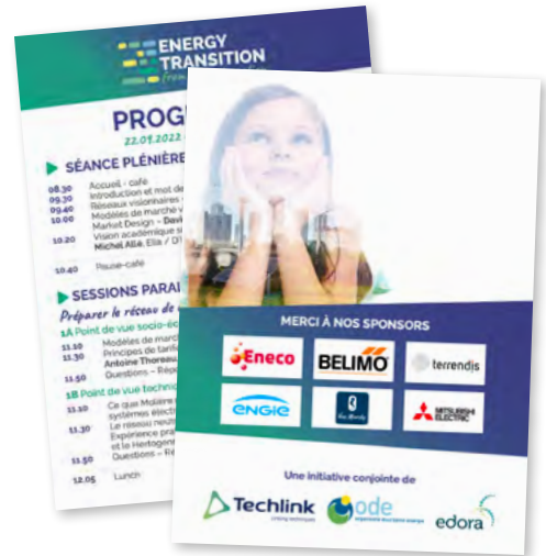
Programme / Flyers